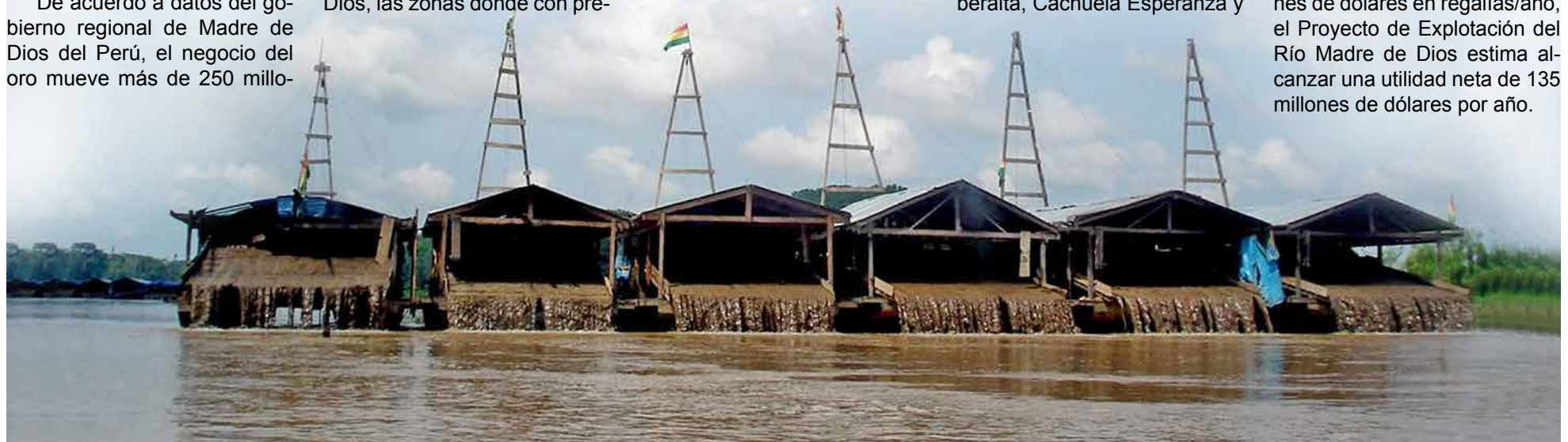
Barcasas en el Río Madre de Dios en la explotación de oro con métodos artesanales

Con la anterior inversión, se logrará cerca de los 22 millones de dólares en regalías/año, el Proyecto de Explotación del Río Madre de Dios estima alcanzar una utilidad neta de 135 millones de dólares por año.