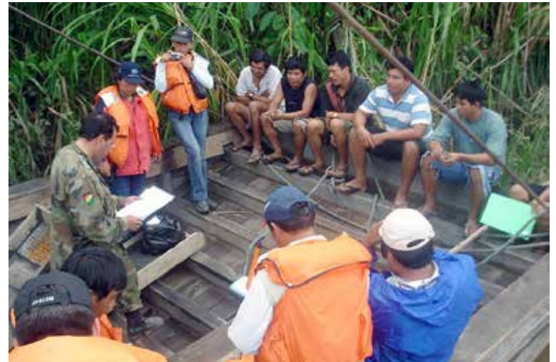
Reunión Fuerzas Armadas, Prefectura del Departamento de La Paz, Pando, COMIBOL

serva geológica para gravas de 3.9 gramos/tonelada de oro" en el Proyecto de Exploración Madre de Dios, presentado por el Servicio Geológico Minero en el 2007.