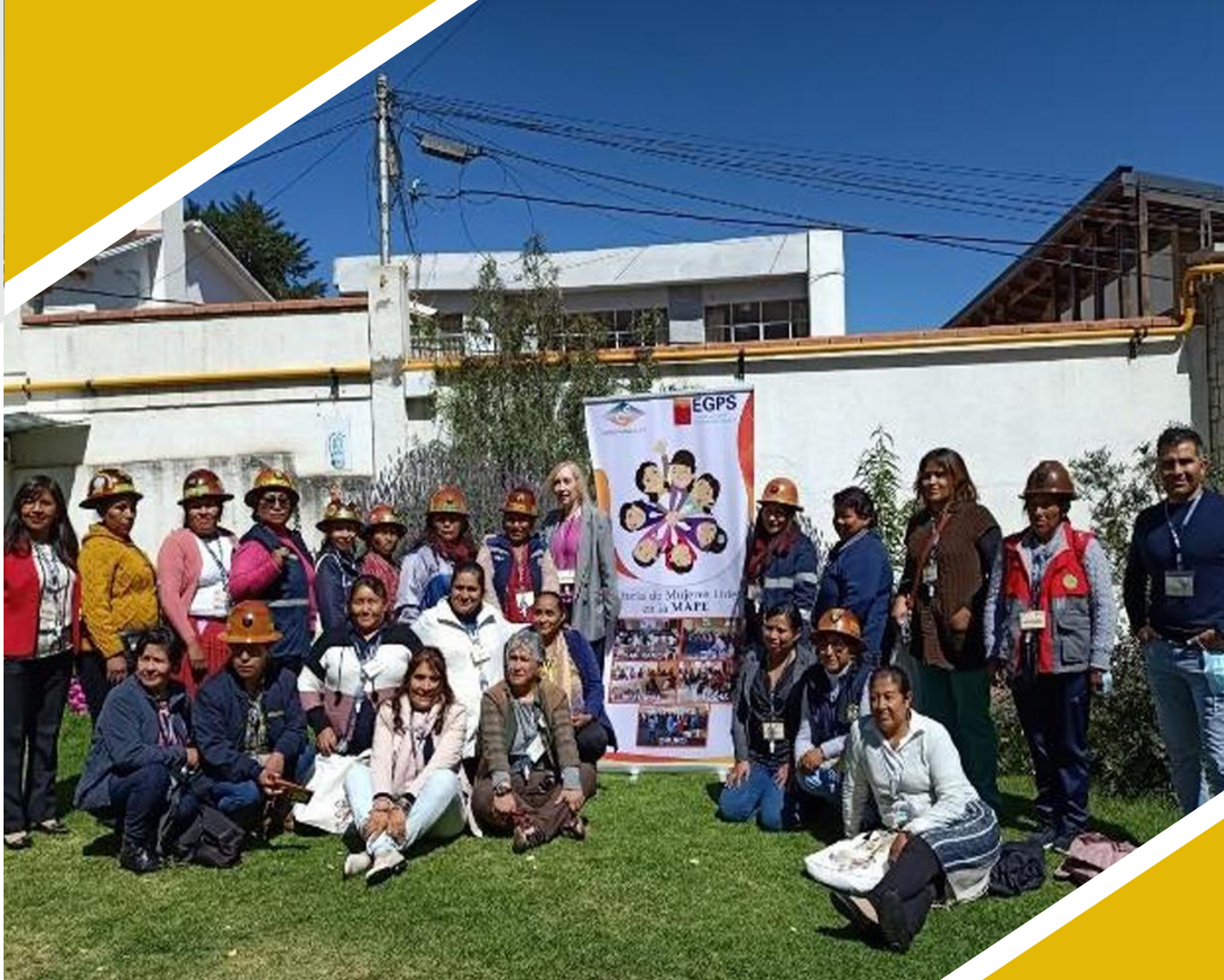
Encuentro de mujeres cooperativistas

“Las mujeres están presentes en la minería boliviana desde tiempos inmemoriales, trabajando y aportando a la economía del país en condiciones no muy diferentes a las de sus antepasa-